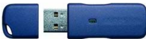
Slika 5: USB memorija

Flash memorije zbog svog kapaciteta i cijene nisu pogodne za trajnu pohranu i čuvanje podataka, ali mogu izvršno poslužiti za redovite sigurnosne kopije materijala koji se često mijenja. Jednostavno se spajaju s računalom, zauzimaju malo mjesta i nemaju pomičnih dijelova u radu, što ih čini prilično pouzdanima. Treba imati na umu da flash memorije imaju ograničen broj zapisivanja. Proizvođači jamče oko 10.000 zapisivanja, a realno je taj broj osjetno veći. Ocjena trajnosti je 4 do 10 godina. Unatoč tomu, dobra je praksa nakon određenog vremena, primjerice 3-4 godine, zamijeniti ove uređaje, tim više ako ih se koristi za pohranu važnih podataka.