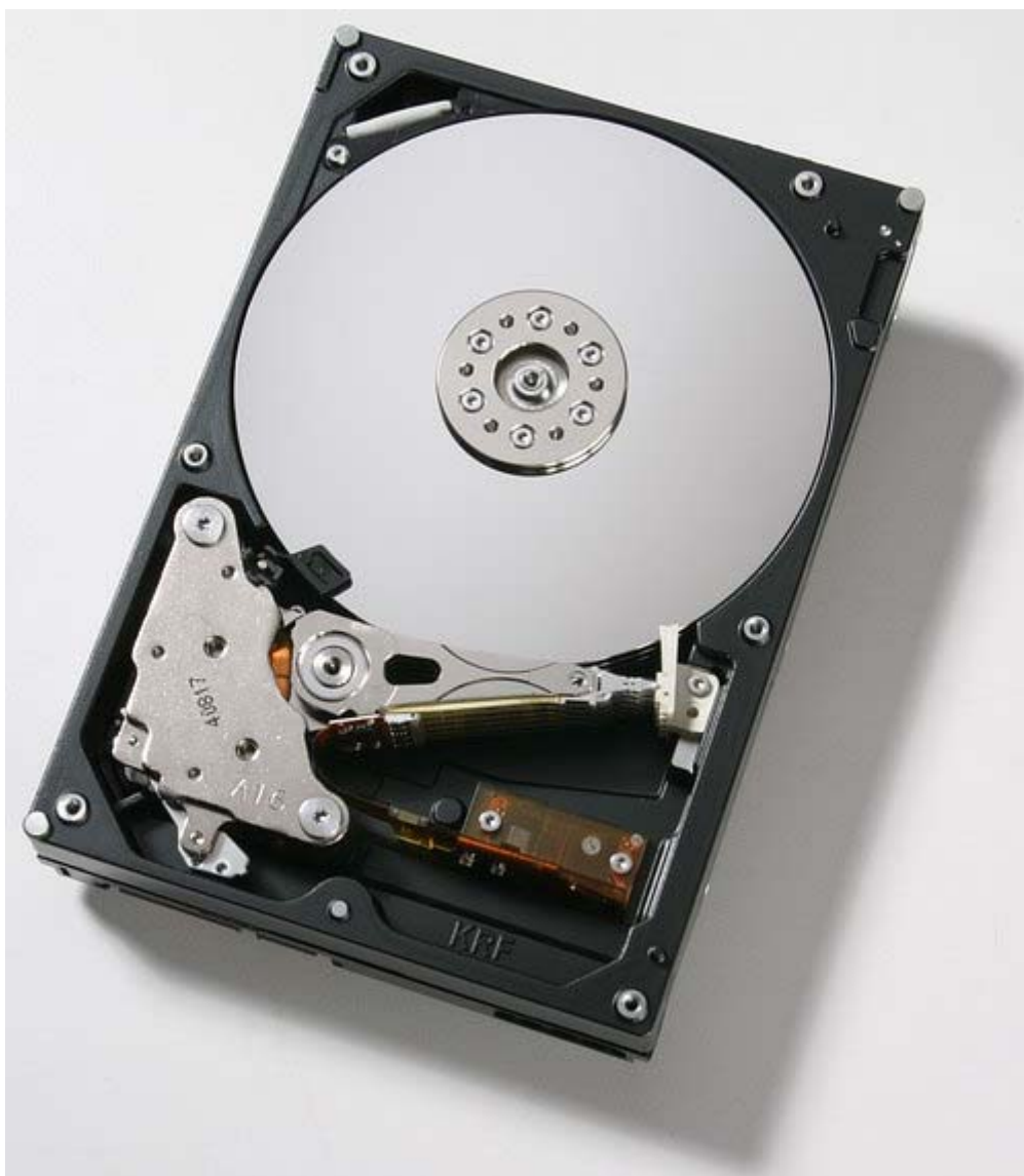
Slika 4: Tvrđi disk

Tvrdi diskovi najpraktičniji su mediji za pohranu podataka, zato ih se i koristi u računalima kao primarno sredstvo te namjene. Temeljni princip rada je taj da su magnetske ploče smještene unutar hermetički zatvorenog kućišta s čijih obiju strana lebde glave za čitanje i pisanje. Prednost predstavlja njihov velik kapacitet (stotine GB), brzo vrijeme pristupa, velika pouzdanost i trajnost te prihvatljiva cijena. Međutim, oni se sastoje i od pomičnih dijelova, zbog čega su osjetljivi na udarce i vibracije, a zahtijevaju i energiju za rad, što ih sve čini relativno rizičnim medijima. Nedostaci uključuju i slabu otpornost na elektromagnetsko polje i nečistoće, a ograničenje gustoće podataka faktor je koji ograničava njegov kapacitet. Proizvođači daju garanciju, a time i implicitno ocjenjuju vijek trajanja na 3 do 5 pa čak i 7 godina.