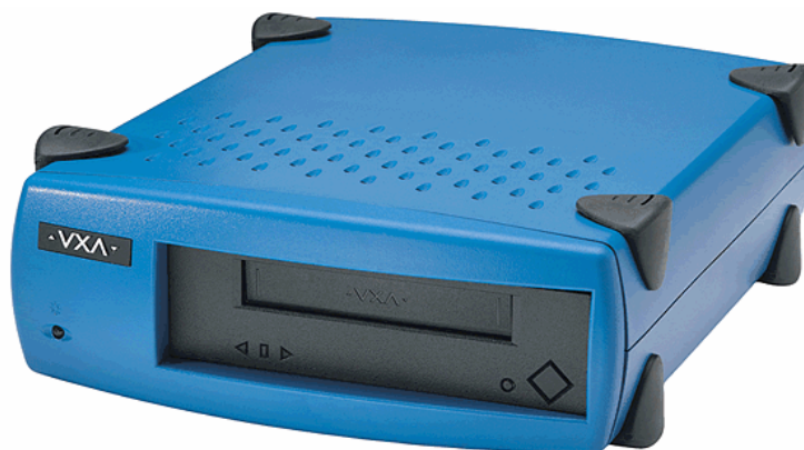
Slika 6: Uređaj za čitanje magnetskih traka

Usporedo s trakama razvijali su se i ostali uređaji za pohranu, a ponajprije se to odnosi na diskove koji su zbog brzine pristupa i pouzdanosti postali nezaobilazan element on-line pohrane podataka. Temeljni princip rada nije se promijenio od njihova nastanka. U hermetički zatvorenom kućištu nalazi se jedna ili više aluminijskih ploča na koje je s jedne ili obje strane nanesen magnetski sloj. Podaci se čitaju i pišu pomoću jedne ili više glava (svaka za jednu stranu pojedine ploče). Taj relativno jednostavan sustav u stanju je u modernim diskovima pohraniti zaista velike količine podataka. Osim kapacitetom, diskovi se odlikuju izuzetno brzim pristupom podacima (mjeri se u milisekundama) te velikom brzinom prijenosa podataka (više desetaka pa i do preko stotinu MB), što ih čini idealnim on-line storage uređajima. Ipak nisu bez mana, a tu se prije svega ubrajaju osjetljivost na udare i vibracije.