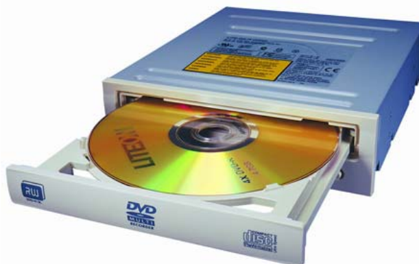
Slika 7: Optički uređaj