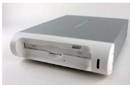
Slika 8: Magneto-optički medij i uređaj