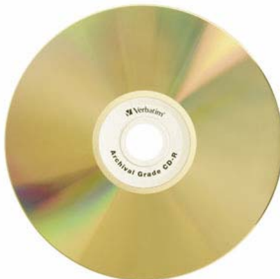
Slika 1: Prepoznatljivi CD medij

Nakon tog, početnog korištenja CD medija kao idealnog medija za distribuciju aplikacija, počinju ga koristiti i proizvođači igara, zbog kapaciteta pogodnog za smještaj većih količina podatka. Kao i u drugim segmentima računala, industrija računalnih igara utjecala je u stanovitoj mjeri na popularnost ovih medija. Optički mediji danas su uobičajen i jednostavan način za pohranu podataka, ali ipak nisu bez nedostataka. Najveći je svakako nemogućnost brisanja jednom zapisanih podataka. U slučaju kada je primarna zadaća izrada arhivskih kopija podataka, to je korisna osobina. No, s obzirom na sve širu popularnost medija, otišlo se korak dalje u nastojanjima da se medij pretvori u tzv. mass storage uređaj za pohranu većih količina podataka. Rezultat je, većini korisnika dobro poznati, CD-RW uređaj koji omogućuje višestruko brisanje i ponovo zapisivanje podataka. Obzirom na lakoću korištenja, pouzdanost zapisa, kapacitet te vrlo nisku cijenu medija, CD-RW tehnologija predstavlja vrlo privlačan način pohrane podataka što dokazuje i veliki broj uređaja koji se nude na tržištu.