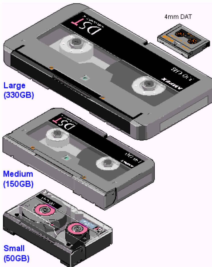
Slika 2: Ilustracija odnosa veličina magnetskih vrpce