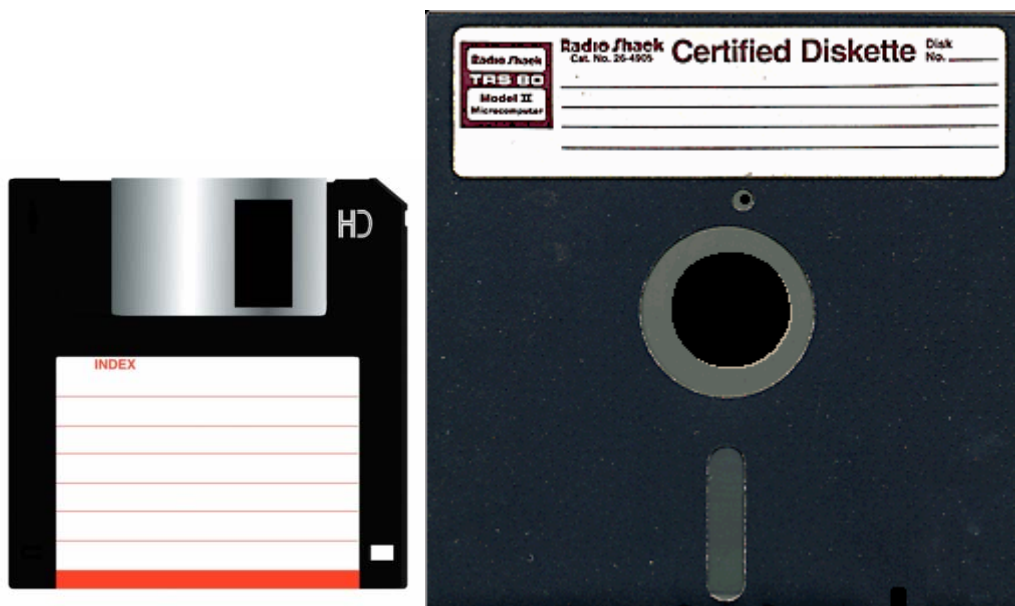
Slika 3: Diskete koje se danas rijetko mogu naći u uporabi

Svi ovi mediji iznimno su osjetljivi na vanjske smetnje, a time su i nepouzdati za dugotrajnu pohranu podataka. Unatoč tomu, iskustva korisnika su različita. U pravilu se vijek trajanja disketa procjenjuje u godinama, a može doseći čak i 15 godina.